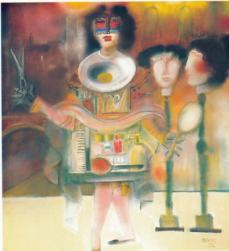
▲ Il Barbiere di Sevilla